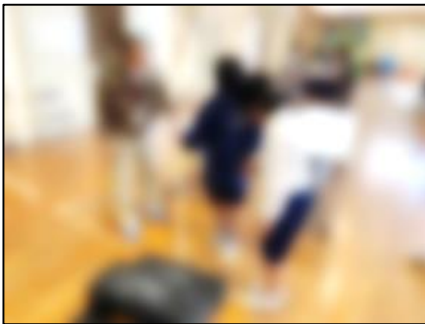
ブラインドウォーク

目が見えない状態で歩いたり、その介助をしたりする体験や、車椅子に乗ったり（押ししてもらったり）、押ししたりする体験などを行い、障がいのある人の立場に立って考えました。実際の体験を通して、考えが深まったようです。学んだことをまとめ、12月3日の人権集会で発表する予定です。